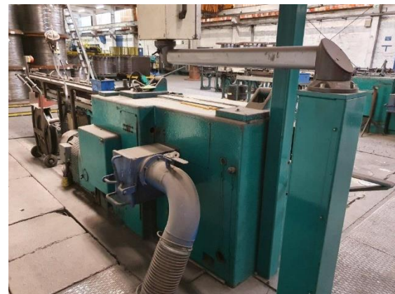
Richtmaschine hintere Ansicht