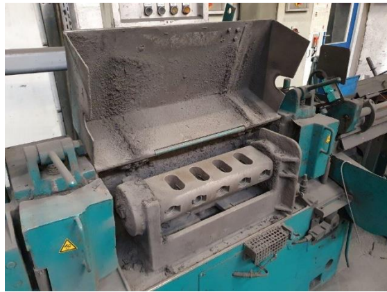
Typenschild und Richtrotor